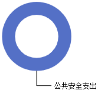
一般公共预算当年拨款结构图

2026年度泽州县看守所一般公共预算当年支出493.70万元，主要用于以下方面：公共安全支出493.70万元，占100.00%等。