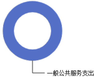
一般公共预算当年拨款结构图

2023年度一般公共预算当年拨款411.86万元,主要用于以下方面:一般公共预算服务支出411.86万元,占100.00%。